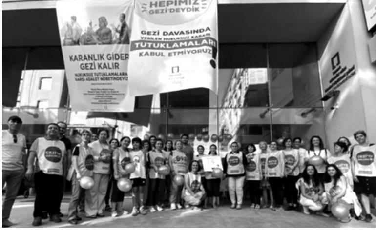
Adalet nöbeti 51. Günü

TMMOB'un 1 Mayıs Maltepe mitingi çağrısı paylaşıldı. Kadın Komisyonu olarak Adalet nöbetlerine katıldı.